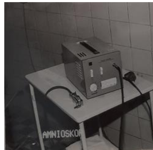
Amnioskop - rok 1973