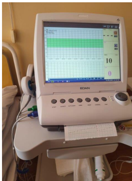
Kardiotokograf - rok 2025