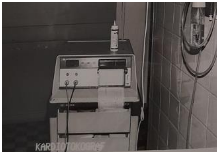
Kardiotokograf – rok 1973

W owym czasie liczba łóżek zwiększyła się do 137. Następuje również zmiana organizacji oddziału - powstają trzy osobne oddziały : Położniczy, Ginekologiczny i Patologii Ciąży. Dla zapewnienia właściwej opieki medycznej Oddział wyposażony jest w nowoczesny sprzęt.